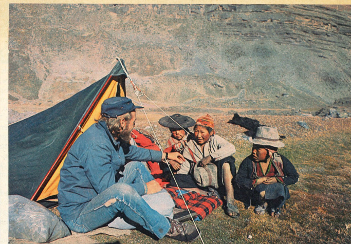
Herzlicher Kontakt trotz Sprachschwierigkeiten: Biwak auf fast 5000 m Höhe in den Anden