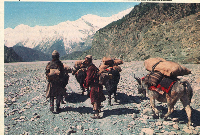
Karawanenleben: Mit Tibetern und Jaks durch den Himalaja (Dhaulagiri-Treck)