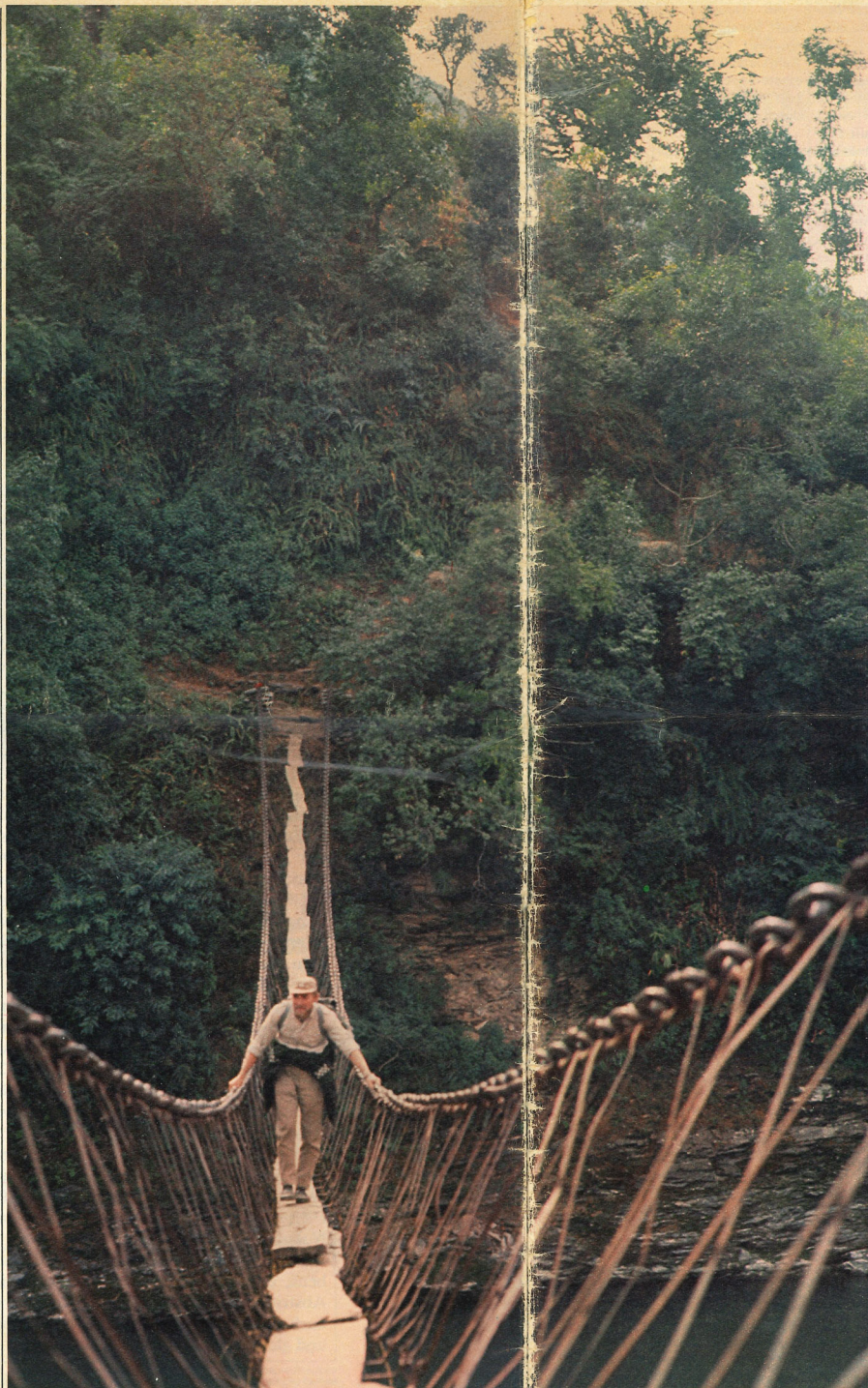
Kein Abenteuer mehr für Trecker: Ein Fluss wird auf schwankender Hängebrücke überquert (Everest-Treck)

Schliesslich gibt es neben dem Bergwandern als «echtster» noch weitere Trekking-Arten; vor allem das «Fluss-Trekking». Empfehlenswert sind z. B. Amazonas (den ich – als erster – von den Quellen bis zur Mündung befuhr), Mekong (von den laotisch-burmesischen Bergstämmen bis zu Kambodschas Weltwunder Angkor), Kok (Nordthailand), Sepik (Neuguinea), Sars-tun (Guatemala), Irrawaddy (Burma) usw. Die oberen, zwischen Hochgebirge und Tiefland liegenden Teile der Flüsse sind am geeignetsten. «Normale» (Wander-)