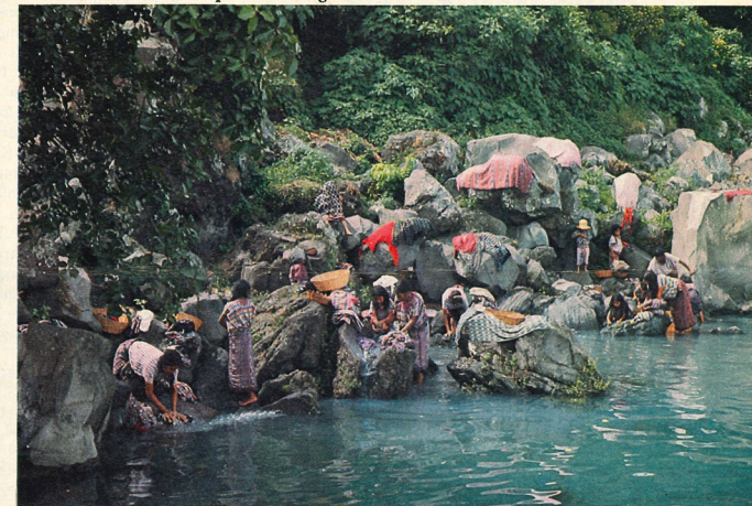
Farbenpracht und Beschaulichkeit: Das einfache Leben der Indianer Lateinamerikas