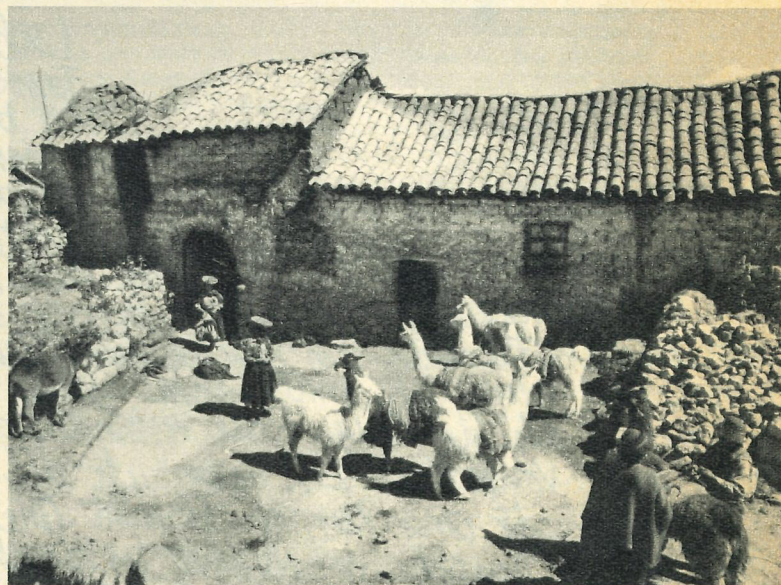
Indios und Lamas im peruanischen Hochland

Die bekannten Trecks im Helambu-Hochland nördlich von Katmandu beanspruchen etwa 10 bis 15 Tage; Ausgangspunkt ist meist Trisuli, das von Katmandu aus per Bus erreicht werden kann. Der leichteste Treck dieser Region ist der eigentliche Helambu-Treck, der anforderungsreichste der Langtang-Treck (da ein 5125 m hoher, fast immer verschneiter Pass über-