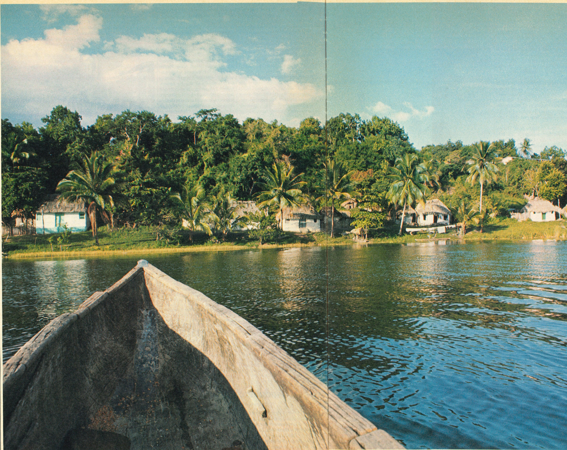
Blick in eine Welt ohne Hetze: Im Kanu durch das guatemalteckisch-mexikanische Grenzgebiet

ausgerüstet. Der Tee ist köstlich, das Essen spottbillig, das Übernachten gratis. Vor dem Schlafengehen stellen sich die einheimischen Reisenden nochmals in Reih und Glied auf und zelebrieren das gymnastikreiche Nachtgebet; wir sind im strenggläubigen Islam. Dann streckt man sich auf den Teppichpolstern in wohliger Wärme satt und zufrieden aus. Wer dann nicht gut schläft, schafft's nimmermehr.