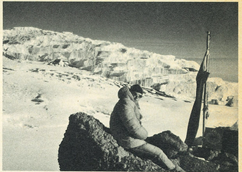
Schnee am Äquator: Kilimandscharo-Krater

Das Ruwenzori-Gebirge in Uganda, dessen Tropenurwälder zu den schönsten und üppigsten der Erde gehören, bietet länger dauernde (bis zehn Tage) und ursprünglichere Bergsafaris als der etwas überlaufene «Kili». Ausgangspunkt ist Fort Portal bzw. das