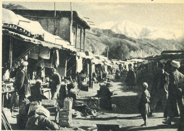
Berge, Pferde und Basare in Afghanistan

heute noch teilweise ihre «heidnischen» Traditionen bewahrt haben. Der zurzeit verlockendste Afghanistan-Treck führt, ob zu Fuss oder hoch zu Ross, über die einsamen Saumpfade des Anjuman-Passes (4200 m), wobei der ganze Hindu-