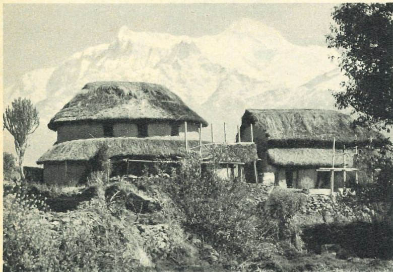
Trekking-Unterkunft vor einem Achttausender

Einer der schönsten Gebirgszüge ist die Cordillera Blanca mit ihren majestätischen Sechstausendern über teilweise subtropischen Tälern mit Orangenplantagen, Eukalyptushainen und Mischwäldern. Hier erhebt sich auch der 6768 m hohe Huascarán – ein lockendes Ziel für erfahrene Alpinisten. «Normaltrekker» begnügen sich damit, diesen höchsten Berg Perus zu umwandern. Ein günstiger Ausgangspunkt ist das – erst noch mit offenem Thermalschwimmbad versehene – Bergsteigerhotel Monterrey bei Huaraz. In diesem Gebiet, zumeist als «peruanische Schweiz» etikettiert, findet man auch einheimische Trekking-Führer und Maultiere. Da auf extremen Höhen nicht immer mit einem rechtzeitig auftauchenden Dorf gerechnet werden kann, empfiehlt sich die Mitnahme eines Biwakzelts. Und ein auf dem